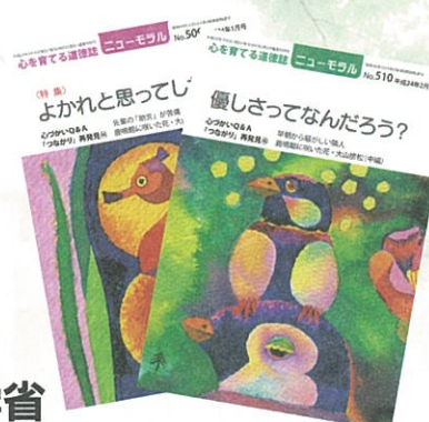
心育てる道徳誌「ニューモラル」

〒277-8654 千葉県柏市光ヶ丘 2-1-1 http://www.morology.jp/